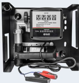
БАК.12082 Станция перекачки топлива БелАК "Антей комплекс" 12V 80л/мин

Станции «БелАК» — изделия с повышенной ремонтпригодностью. Для каждой модели станций можно найти роторы, лопадки, фильтры грубой и тонкой очистки — наиболее изнашиваемые детали.